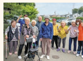
▲「散歩」外は気持ちいいですね