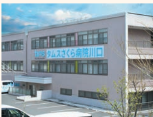
▲ タムスさくら病院川口

同グループのタムスさくら病院川口は二次救急や認知症治療、リハビリテーションなどの機能を持つほか、デイケアでは身体機能の維持・回復をめざし専門職によるケアを受けることが可能です。いずれも車で3分の立地にあり、急な体調不良や身体機能の衰えを感じた時にもグループ間で連携し、入居様を支えられるよう環境を整えています。