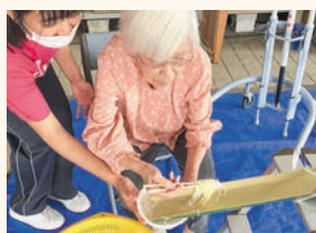
▲「流しそうめんレク」 楽しいイベントです