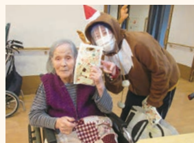
▲「クリスマス」プレゼントを♪