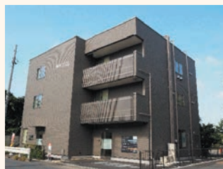
▲ タムスさくらクリニック川口