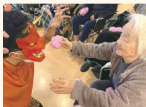
▲「節分の日」鬼とバシャリ