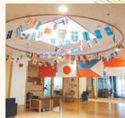
◀ 国際色豊かな エントランスホール