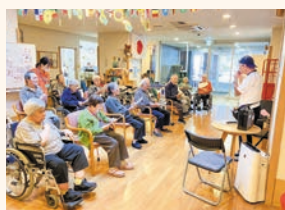
▲「ハーモニカボランティア」 きれいな音ですね